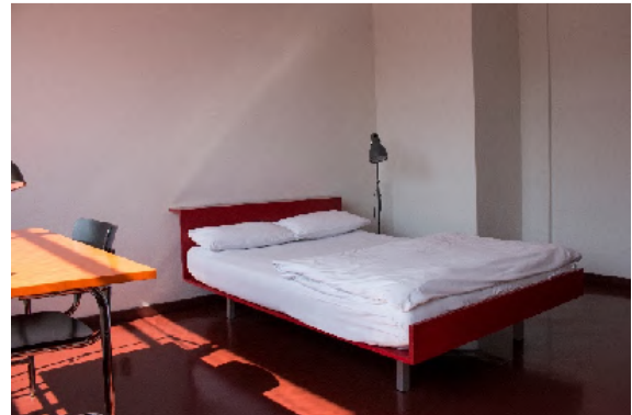
Stiftung Bauhaus Dessau / Foto: Willmington-Lu, Yakob Israel, 2018

Schlafen wie ein Bauhüsler – in der Unterkunft Bauhaus Dessau haben Sie die Möglichkeit dazu. Von dem Grundriss über die Materialität bis hin zu den Nachbauten der Originalmöbel wurde alles bis ins Detail in seinen ursprünglichen Zustand versetzt. Die Zimmer verfügen über ein Waschbecken. Bad und WC befinden sich auf dem Flur. Die Unterkunft verfügt über keinen Aufzug. Das Frühstück wird im Bauhaus-Bistro eingenommen. Da nur wenige Doppelzimmer vorhanden sind, werden Paare z. T. in 2 Einzelzimmern untergebracht.